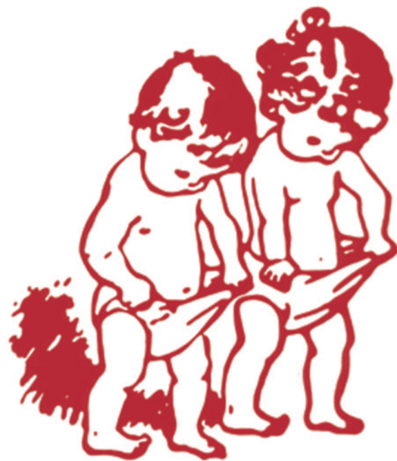
Oh, that explains the difference in our salaries!

Es zeigt sich auch, dass Frauen tendenziell eher die Verliererinnen von (Teil-)Privatisierungen ehemals (sozial-)staatlich organisierter Bereiche, wie zum Beispiel dem Gesundheitssystem, sind. Erstens sind überdurchschnittlich viele Frauen im öffentlichen Sektor beschäftigt, in dem die Lohnschere zwischen Männern und Frauen deutlich geringer ist als in der Privatwirtschaft. Zweitens gehen Privatisierungen vor allem zulasten ärmerer Bevölkerungsschichten, die in einem solidarisch organisierten System auch bei keinen oder geringen Beitragszahlungen eine soziale Absicherung erhalten und sich private Anbieter_innen oft nicht leisten könnten. Zu den Armen zählen, wie schon gesagt, überdurchschnittlich viele Frauen. Und drittens werden durch Liberalisierung-