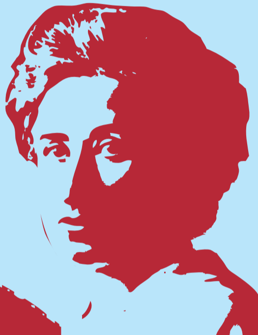
Rosa Luxemburg (dt. Politikerin, 1871-1919)