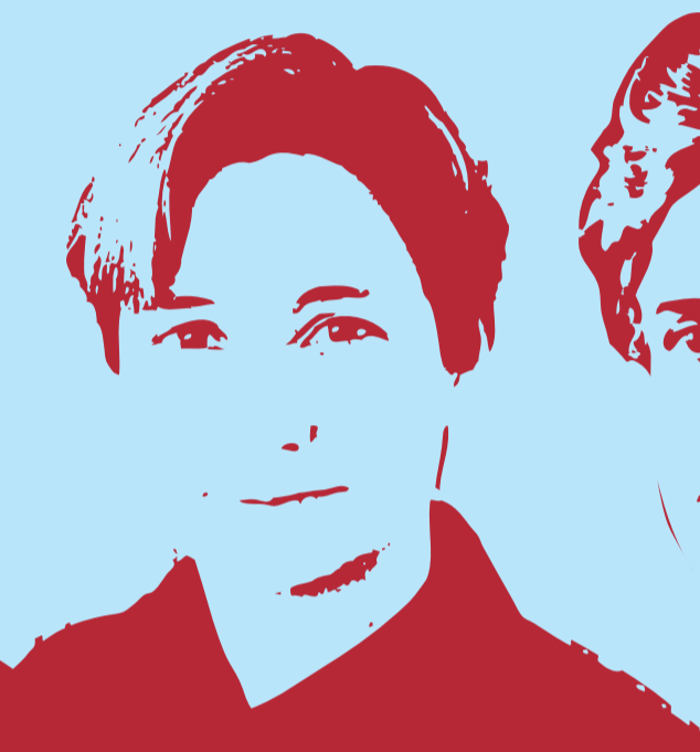
Judith Butler (US-Philosophin und Feministin)