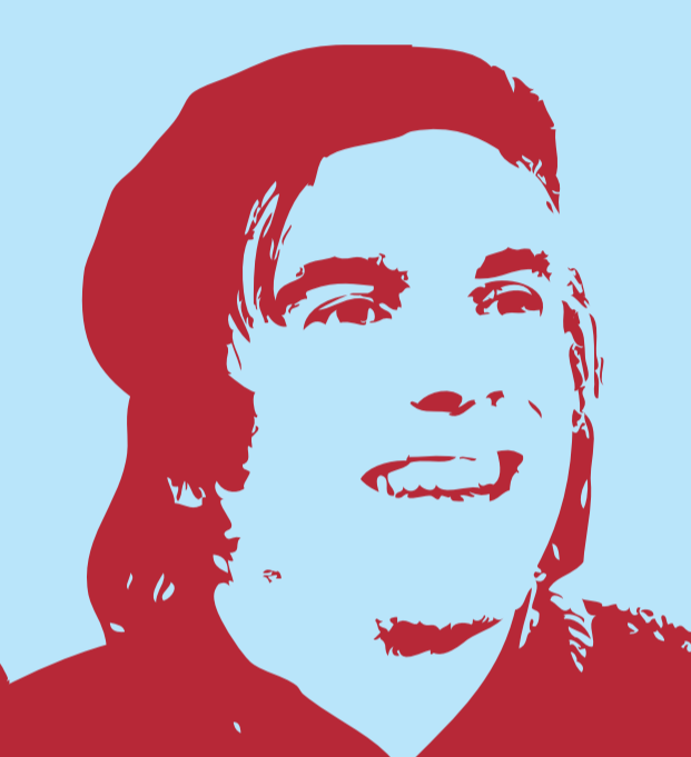
Rudi Dutschke (dt. Studierendenführer, 1940-79)