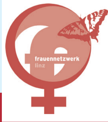
Linzer Frauennetzwerk Stahlstadtfrauen

„Aus taktischen Gründen leiser zu treten, hat sich noch immer als Fehler erwiesen.“