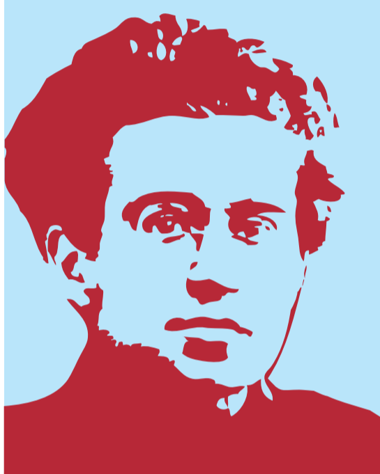
Antonio Gramsci (ital. Schriftsteller und Philosoph, 1891-1937)